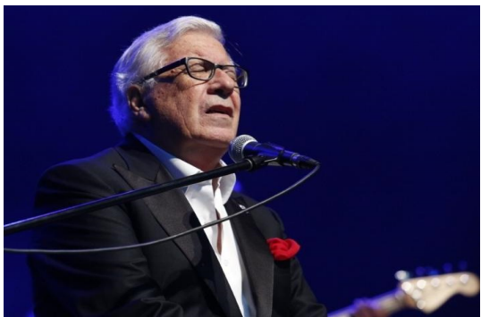
IX EDIZIONE 2015 Direttore artistico: PEPPINO DI CAPRI