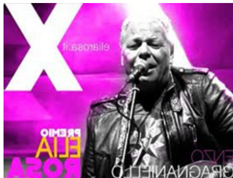
X EDIZIONE 2016 Direttore artistico: ENZO GRAGNANIELLO