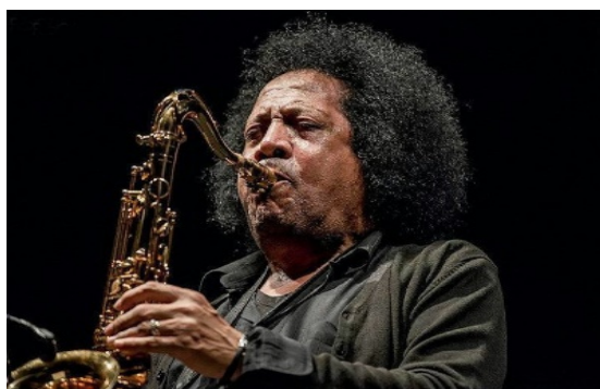
XI EDIZIONE 2017 Direttore artistico: JAMES SENESE